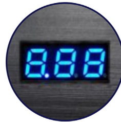
Display indicador de voltaje de batería