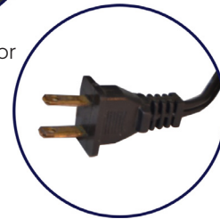
Conector para tomacorriente de 120V