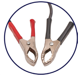
Pinzas positiva y negativa