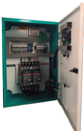
TABLERO DE CONTROL Y TRANSFERENCIA MCA GP TIPO AUTOSOPORTADO MODELO GP- B TIPO NEMA1

El tablero de transferencia automático modelo GP-200 (220V) formado por interruptores termomagnéticos de 630 Amp. tiene la función de arrancar, parar, proteger tanto el motor diesel como el generador eléctrico y hacer la transferencia y retransferencia de la carga de la red de CFE a la planta y viceversa por medio del módulo de control DSE-4520. Todo esto de forma automática o manual.