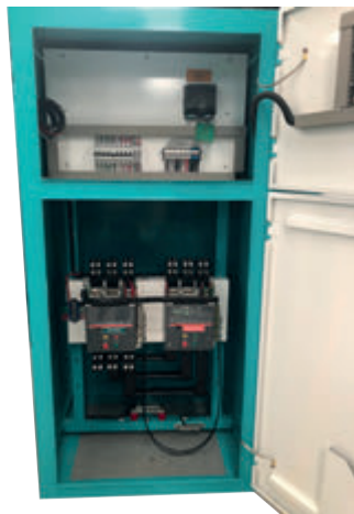
TABLERO DE CONTROL Y TRANSFERENCIA MCA GP TIPO AUTOSOPORTADO MODELO GP-C TIPO NEMA1

El tablero de transferencia automático modelo GP-500 (220V) formado por interruptores electromagnético de 1600 Amp. tiene la función de arrancar, parar, proteger tanto el motor diesel como el generador eléctrico y hacer la transferencia y retransferencia de la carga de la red de CFE a la planta y viceversa por medio del módulo de control DSE-7320. Todo esto de forma automática o manual.