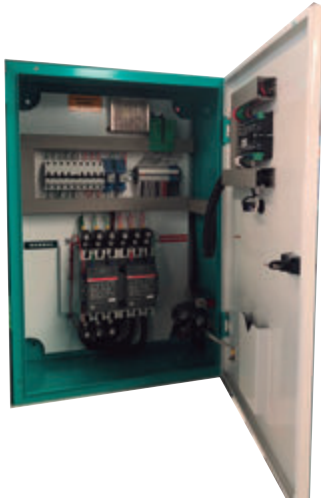
TABLERO DE CONTROL Y TRANSFERENCIA MCA GP TIPO PARED MODELO GP- A TIPO NEMA1

El tablero de transferencia automático modelo GP-80 (220V) formado por contactores magnéticos de 220 Amp. tiene la función de arrancar, parar, proteger tanto el motor diesel como el generador eléctrico y hacer la transferencia y retransferencia de la carga de la red de CFE a la planta y viceversa por medio del módulo de control DSE-4520. Todo esto de forma automática o manual.